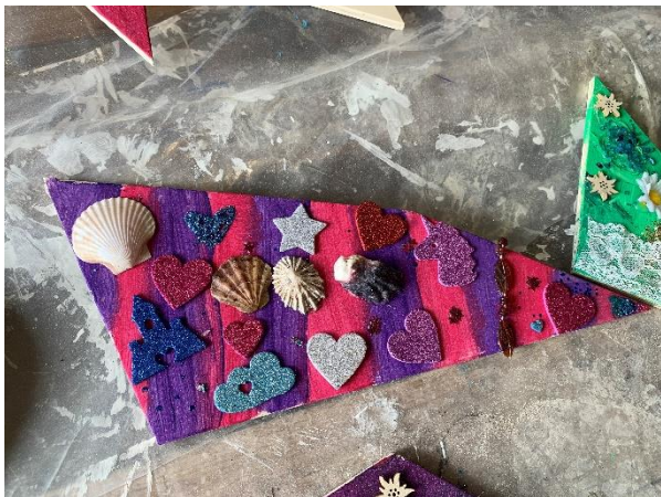
Jedes trägt als Baustein zum Ganzen unserer Schule bei.